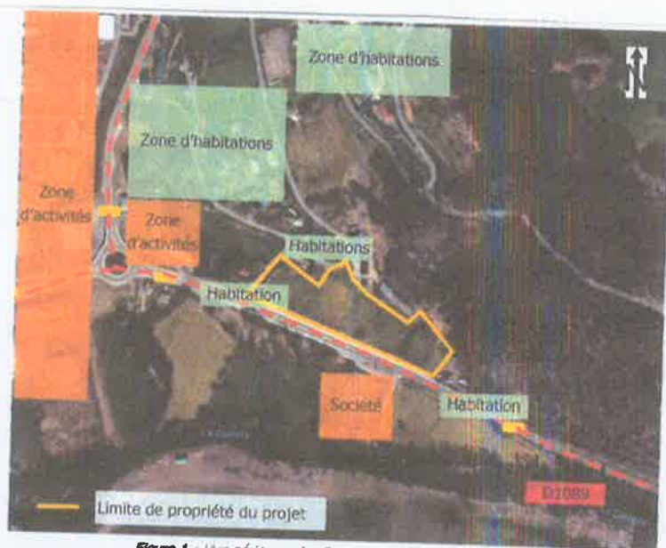
Figure 1 : Vue aérienne du site et de son environnement.

Ci-dessous vue aérienne du site d'implantation de la station avec dans sa périphérie les habitations :